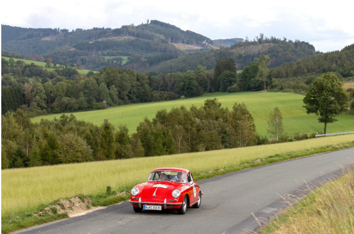
Beste Kombination: Porsche-Historie eingebettet in schöne Landschaften rund um Schmalleben. Die 3. Röhrl-Klassik wird unzählige solcher Motive liefern. Der rote Sportwagen ist ein Porsche 356 (BJ 1962).