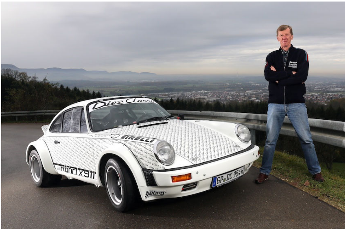
Geht in einem Porsche 911 S 2.7 Coupe von 1975 an den Start: Rallye-Legende Walter Röhrl wird den besonderen Porsche mit 911 Röhrl-Signaturen auf der 3. Röhrl-Klassik 2024 steuern.